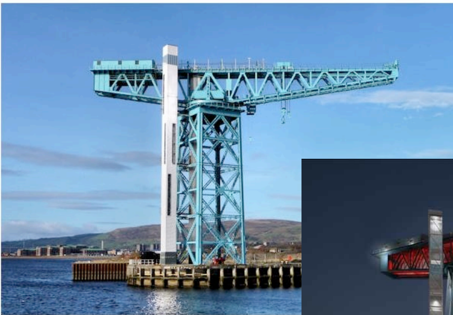
Titan Crane op de Clydebank in Glasgow

Waarom geen mogelijkheid om via parallelle trap of liftkoker naar omhoog te gaan tot een panoramisch platform om te genieten van het prachtige Scheldezicht? Inspiratie hiervoor vinden we in in Glasgow (Schotland) waar de Titan Crane op de Clydebank op een prachtige manier is gerenoveerd en omgevormd tot bezoekerscentrum met lift en platform.