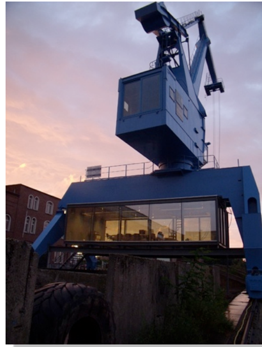
Blauwe kraan dok Noord Gent

http://content.jobat.be/nl/artikels/werkbeeld-de-blauwe-kraan-makelaarskantoor , http://www.doknoord.be/dok-noord/de-blauwe-kraan