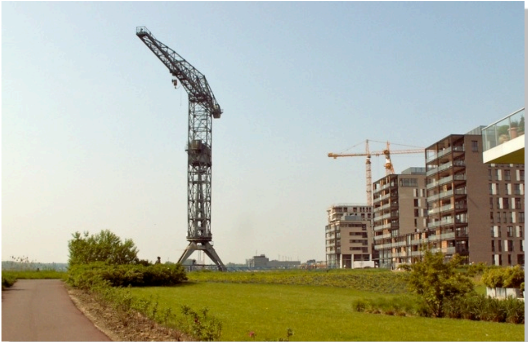
M22 Torenkraan op site De Zaat in Temse

Op woon- en KMO-zone De Zaat in Temse staat een M22 torenkraan die ons herinnert aan de periode dat op deze site schepen werden gebouwd door de Boelwerf. De kraan is het belangrijkste zichtbare restant van deze werf en werd in 2004 als monument beschermd.